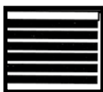
Rolläden & -tore