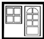
Fenster + Türen